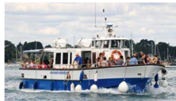
Le Bois d'Amour