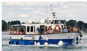
Le Bois d'Amour